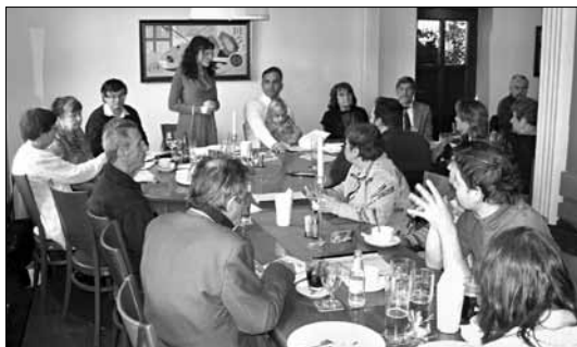
Závěr maratону v HK