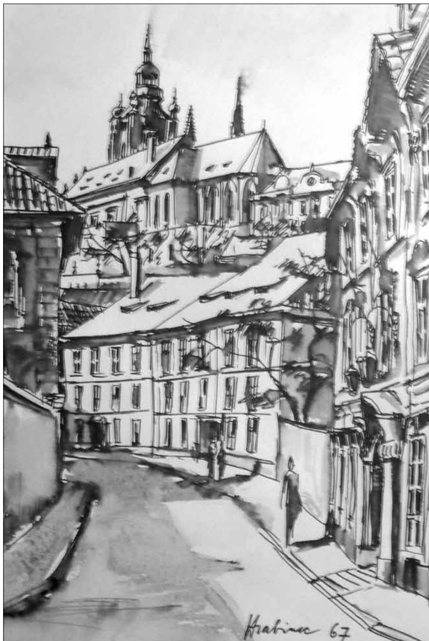
Jiří Hrabinec, ilustrace PRAHA