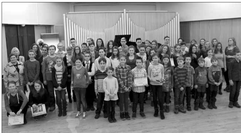
všichni účastníci Pardubických Strípků