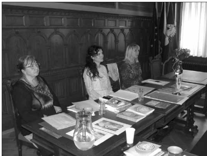
SÁL – PŘEDSEDNICTVO