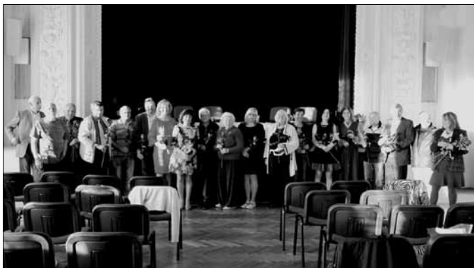
Společné foto autorů sborníku