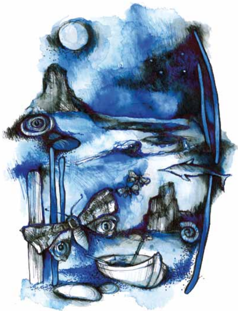
Ilustrace Martiny Jirčíkové: LIŠAJ. Byla použita při ilustraci knihy MODREJ ČAS