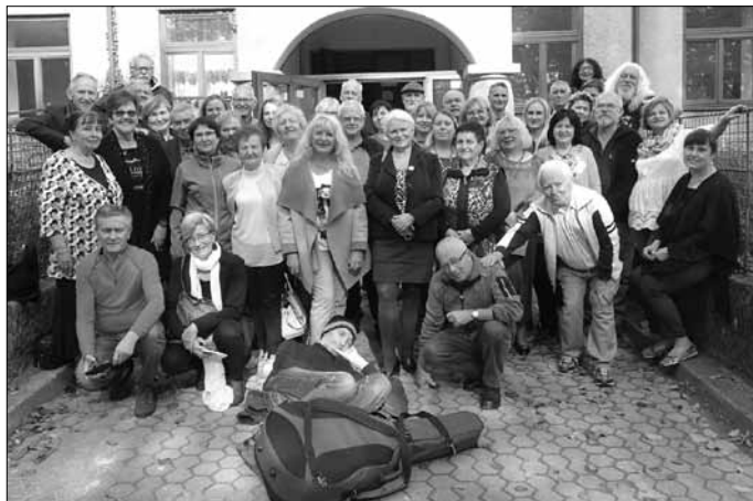
FOTO ÚČASTNÍKŮ XX. Dnů poezie v Broumově