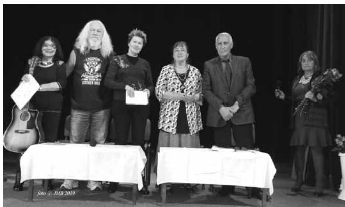
Foto hostů ze Dnů poezie v Broumově

Pak už jen možnost vyzvednutí samotného sborníku a hurá na raut, který je v Přelouči tradičně bohatý a chutný.