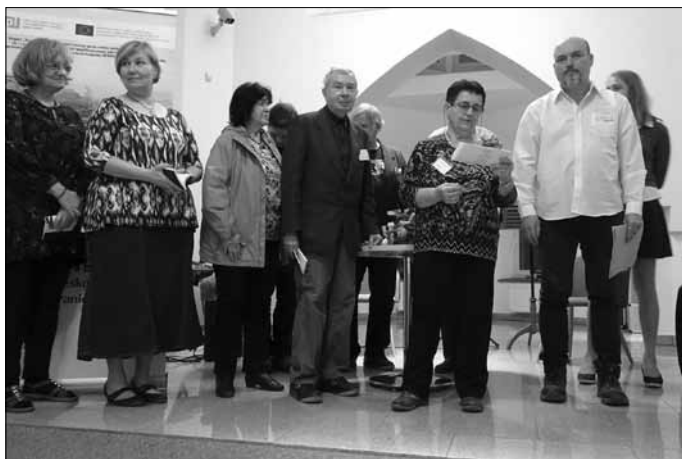
Čeští autoři se představují v polských Ludwikovicích