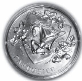
FOTO MEDAILE A PAMĚTNÍHO LISTU

„Medaili města udělují Pardubice od roku 1994. Dnešní laureáti začali psát osmou desítku významných osobností, úspěšně působících v rozličných oborech, kteří během let dosáhli tohoto ocenění. Vždy jsou to lidé, kteří se svou prací zasloužili o rozvoj a věhlas města, lidí, jejichž činnost byla či je pro Pardubice dlouholetým přínosem. Bez ohledu na to, čemu se věnují, si zaslouží naši úctu