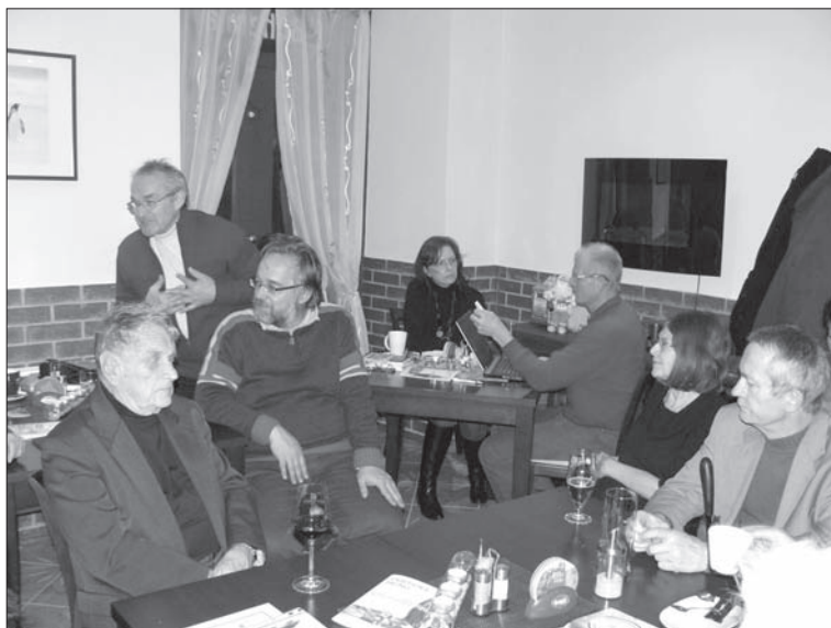
Ze shromáždění na závěr Uměleckého maratónu v restauraci Bohemia

Vidím vnoučka táhnout po zemi kabát svého dědečka táhne ho jako vozík k popelnici Už není, kdo by ho nosil už nikdo nevnímá že mne tenhle obrázek může bolet