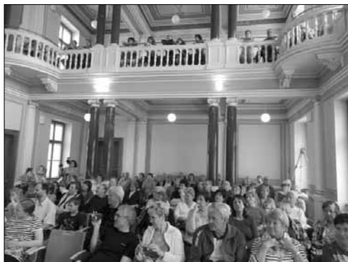
Plný sál Magistrátu