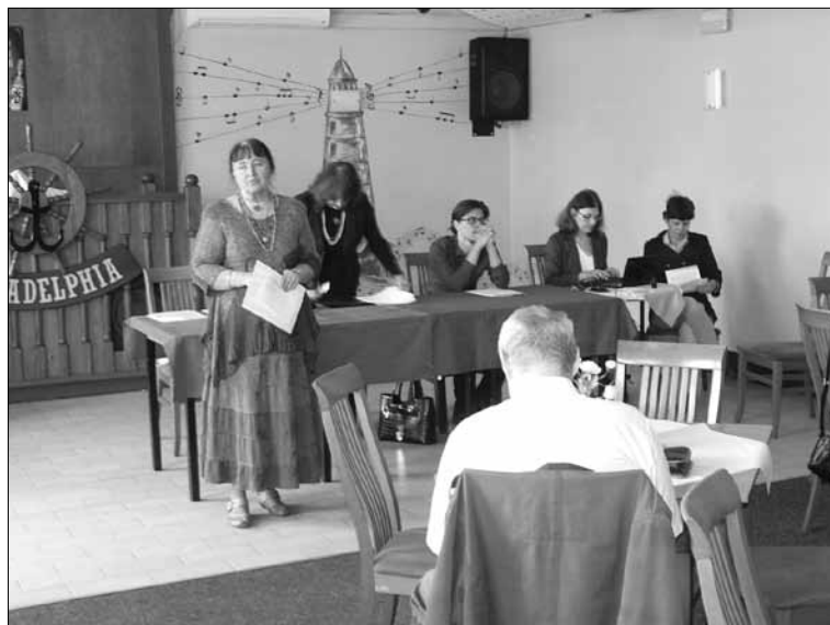
FOTO Z VÝROČNÍ ČLENSKÉ SCHŮZE 26. 4. 2014