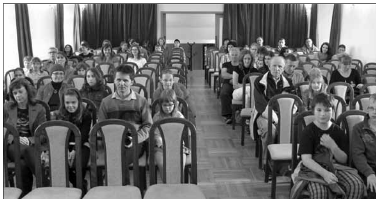
FOTO Z VYHODNOCENÍ SOUTĚŽE V LANŠKROUNĚ

Dokud je jaro tesklivým umělcem, svět bude malován upřímnou poezií a lidským úžasem.