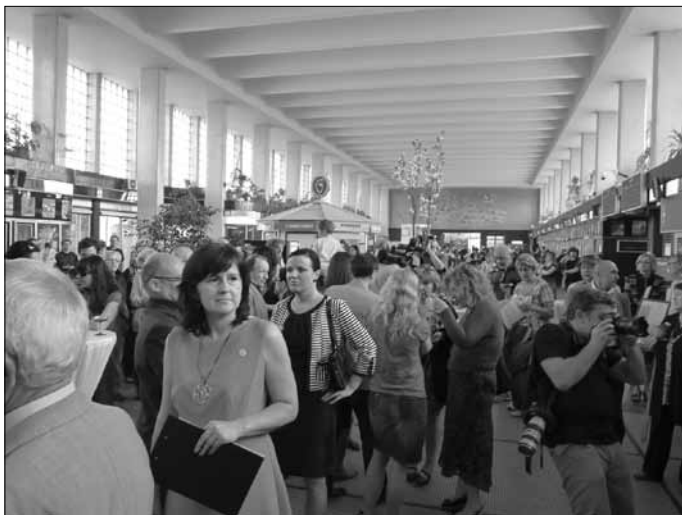
Účastníci otevření Mozaiky v hale nádraží

Ve čtvrtek 1. května bylo slavnostně otevřeno knihkupectví MOZAIKA na pardubickém nádraží, které bude přednostně nabízet knihy regionálních autorů.