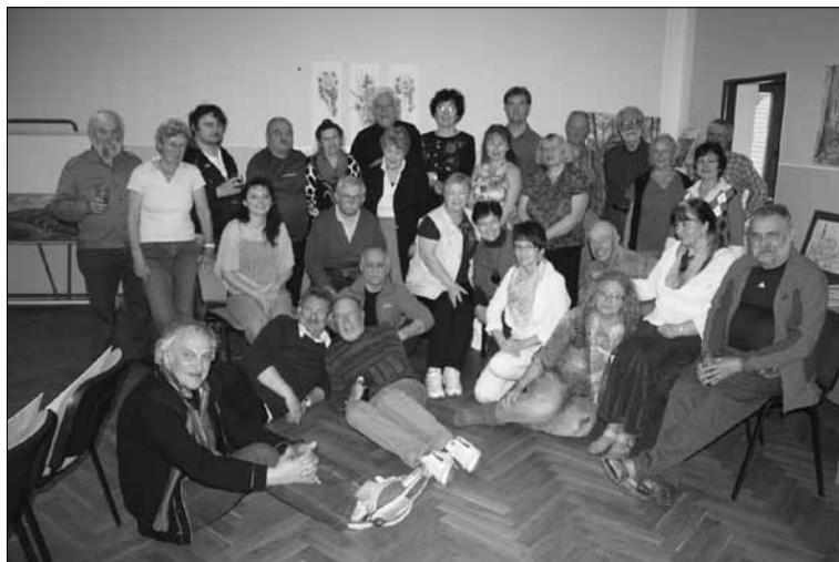
účastníci plenéru v Křinicích