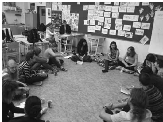
Z akce na Gymnáziu Boženy Němcové v HK