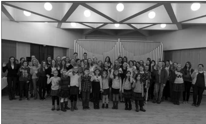
Mladí účastníci vyhodnocení