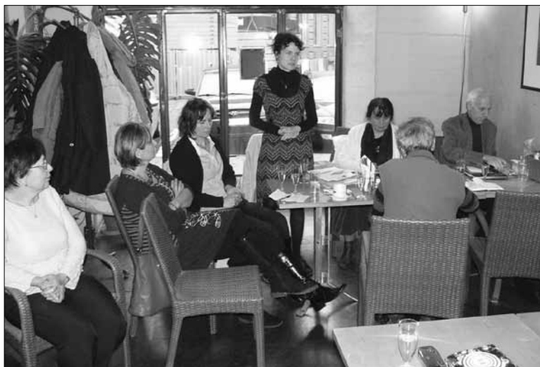
Ze slavnostního zakončení Uměleckého maratónu v restauraci U Knihomola

Následovala volná zábava, při které přítomní dostali možnost zaplatit členský příspěvek a předplatné na čtvrtletník Kruh pro rok 2015 u pokladníka Jiřího Faltuse.