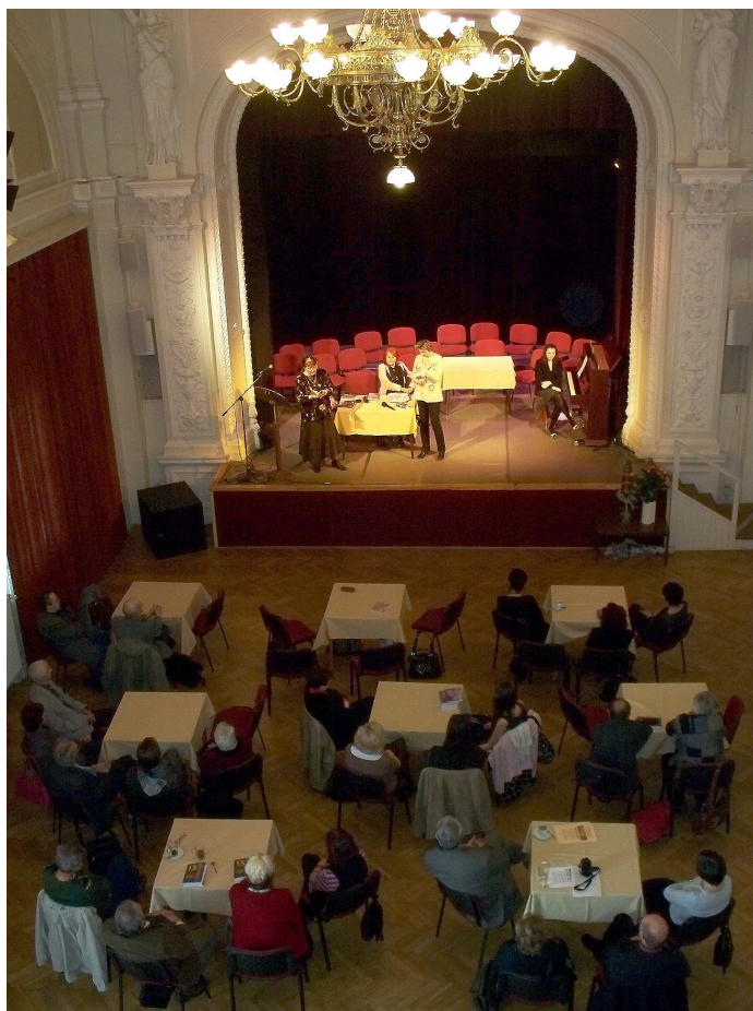
Křest sborníku Třináct východočeských autorů povídek s tajemstvím v historickém sále Zálužny v Přelouči