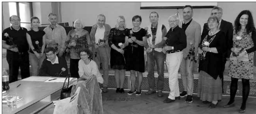
SPOLEČNÁ FOTKA přítomných autorů ze sborníku Kdo mi šlape na paty