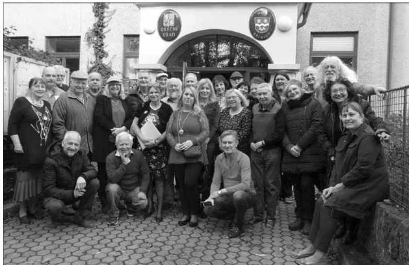
Účastníci XXII. Dnů poezie v Broumově