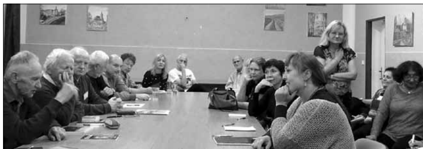
Tvůrčí dílna Dnů poezie