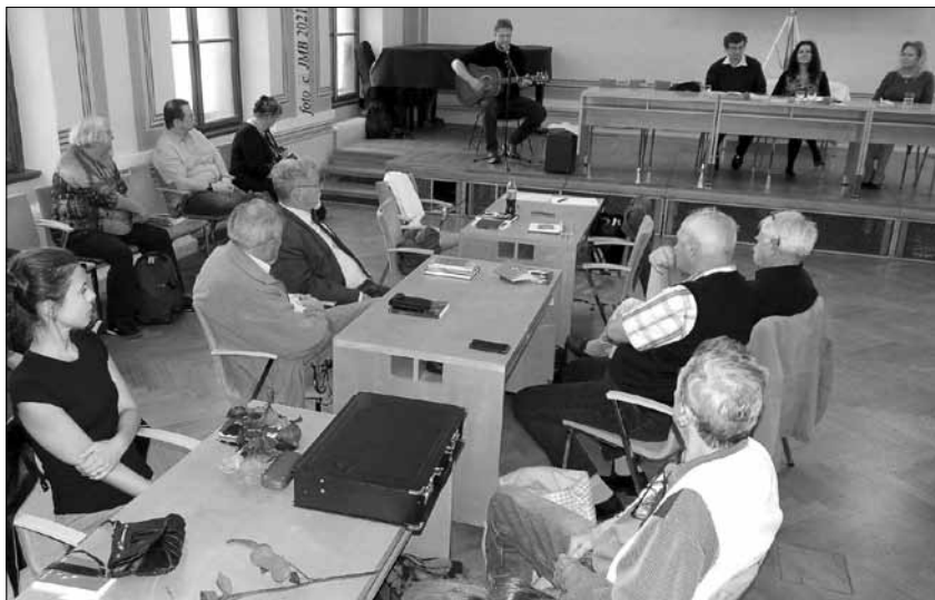
FOTKA ZE ZAHÁJENÍ V PARDUBICÍCH – Celkový pohled na schůzující